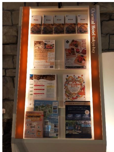
リーフレットスタンド 3ヶ所