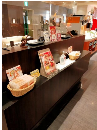
レストラン グランサンク 2ヶ所 ラウンジ ブローニュの森 1ヶ所