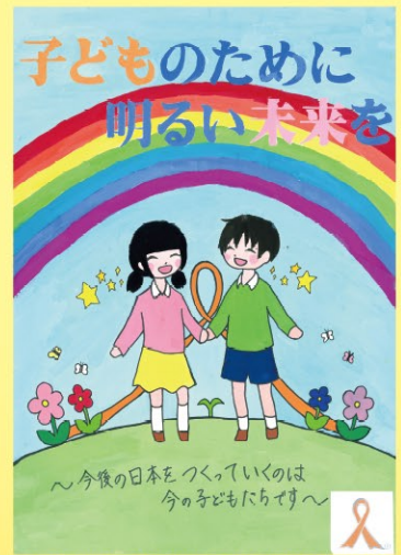
○オレンジリボン公式ポスターコンテスト2017 応募作品