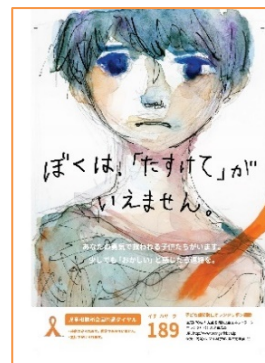
<オレンジリボンサポーター賞>