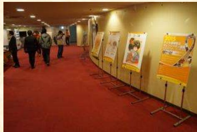
子どもの虐待死を悼む市民集会にて