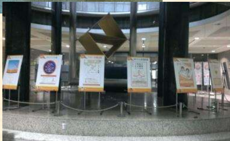
都庁1階ホール(11月児童虐待防止推進月間中)にて