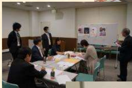
1次審査通過した150作品