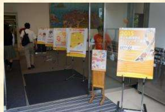
子ども虐待防止オレンジリボンフォーラムにて